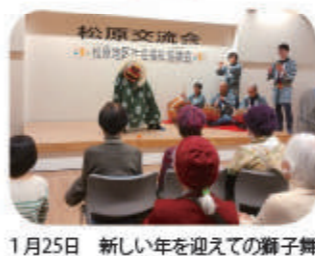
1月25日 新しい年を迎えるの獅子舞