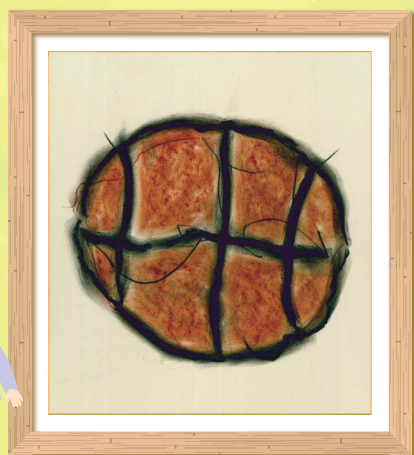
▲「母をイメージするもの～バスケットが好きだから～」 東北沢つどいの家