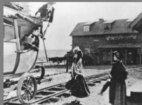
②荒武者キートン(1923年)