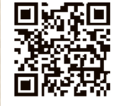
総合フラザ ホームページ